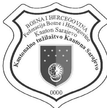
Izgled mesingane iskaznice